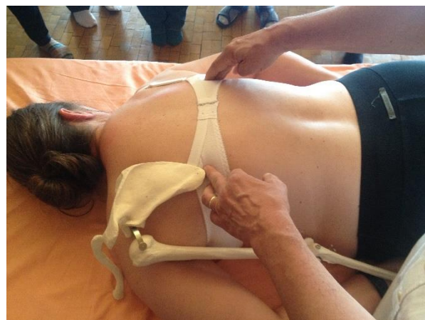
Suchen des 7. BW auf der Höhe von SES 9