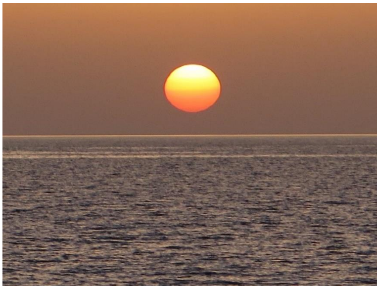
Die Sonne als Quelle für das Licht und das Feuer auf der Erde

Wer den NL nicht mehr erhalten möchte, kann dies unter kontakt@lebens-oase.ch mitteilen. Alle bisherigen Ausgaben stehen unter www.lebens-oase , auf www.jinsjinjyutsu.ch , sowie neu auf www.hands-on.works weiterhin als Download zur Verfügung.