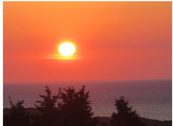
Sonnenuntergang auf Kos, Juni 2018

Nachgedacht Sauerstoff und das Feuer Seite 2 Sommersonnenwende Seite 4